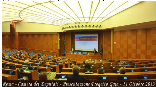
Roma - Camera dei Deputati - Presentazione Progetto Gaia - 11 Ottobre 2013

Il "Progetto Gaia-Benessere Globale" è un programma di educazione alla consapevolezza globale e alla salute psicofisica ideato e sviluppato da un'equipe di docenti, professori universitari, educatori, psicologi e medici dell'associazione di promozione sociale "Villaggio Globale" di Bagni di Lucca, che è stato approvato e finanziato dal Ministero del Lavoro e delle Politiche Sociali , e che è sostenuto dall' UNESCO , l'agenzia delle Nazioni Unite per l'Educazione, la Scienza e la Cultura.